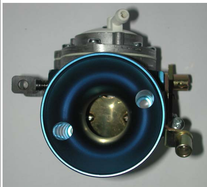
PHOTO CÔTÉ ASPIRATION PHOTO OF INLET SIDE

This Homologation Form reproduces descriptions, illustrations and dimensions of the carburettor at the moment of the CIK-FIA homologation. The Manufacturer may modify them, but only within the limits fixed by the CIK-FIA regulations in force.