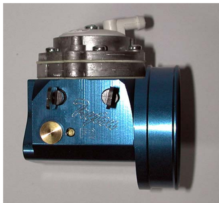
PHOTO CÔTÉ RÉGLAGE PHOTO OF ADJUSTING SIDE

Signature et tampon de l'ASN Signature and stamp of the ASN